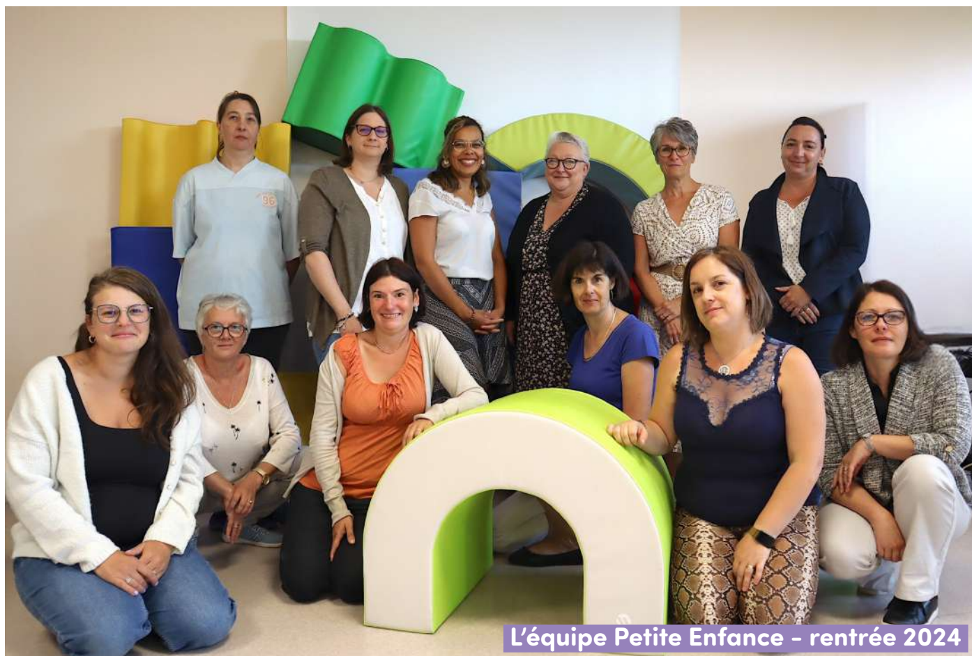
L'équipe Petite Enfance - rentrée 2024

Le pôle petite enfance de la Communauté de communes Thelloise propose différents services.